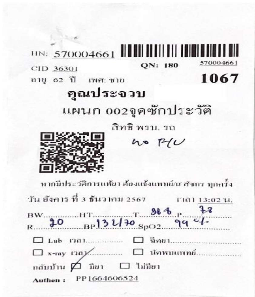
รูปที่ ๒ ใบ Visit ผู้ป่วย

๖.๑ ใบ Visit ผู้ป่วย ใช้ยืนยันตัวตนของผู้ป่วย มีชื่อ-นามสกุล อายุ